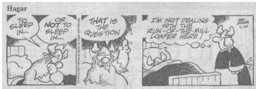
Abbildung 1: Hagar Cartoon

Was Shakespeares Hamlet betrifft, bietet sich vor allem der Deutsch- und Kunstunterricht für fächerübergreifendes bzw. fächerverbindendes Arbeiten an.