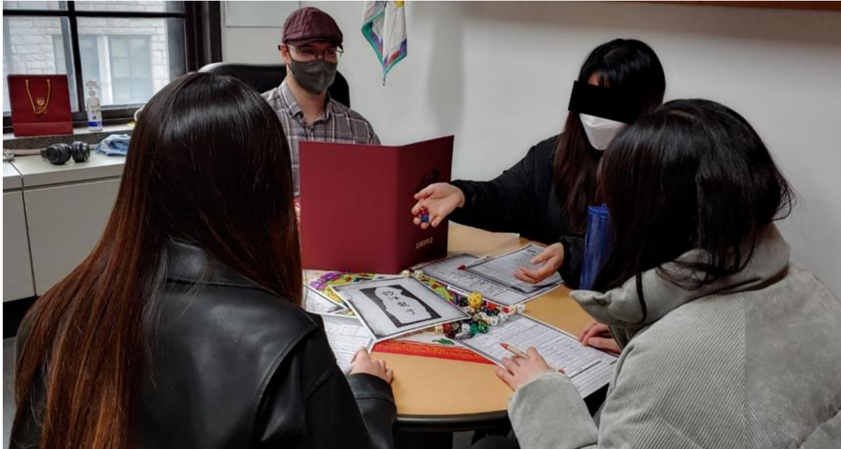
Abbildung 1: Darstellung einer Rollenspielsitzung aus der Rollenspiel-AG.